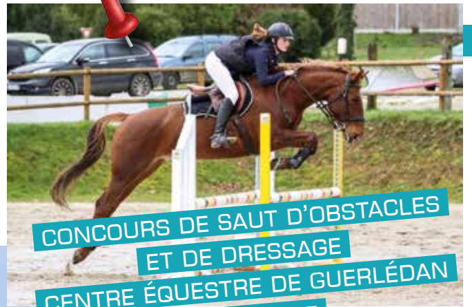
CONCOURS DE SAUT D'OBSTACLES ET DE DRESSAGE CENTRE ÉQUESTRE DE GUERLÉDAN SEPTEMBRE