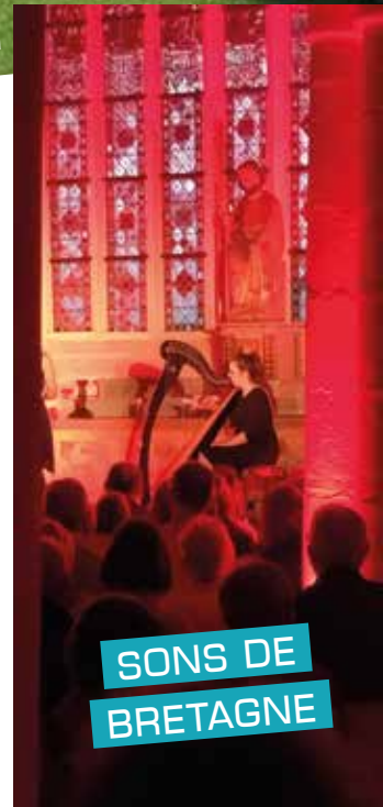
SONS DE BRETAGNE