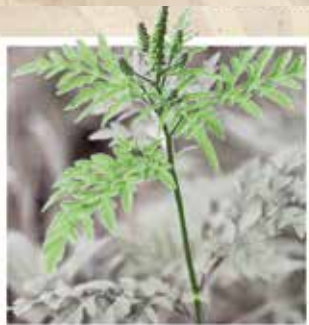
L'AMBROISIE À FEUILLES D'ARMOISE