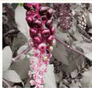
LE RAISIN D'AMÉRIQUE