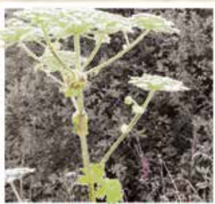
LA BERCE DU CAUCASE