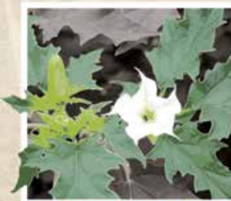
LE DATURA STRAMOINE