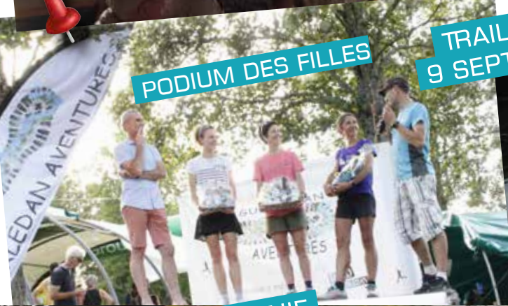
TRAIL DU LAC 9 SEPTEMBRE