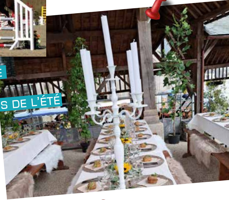
TABLÉE DE LOÏC, REPAS CHAMPÊTRE PROPOSÉ PAR LE CHEF ÉTOILÉ CHRISTOPHE LE FUR TOUS LES VENDREDIS DE L'ÉTÉ