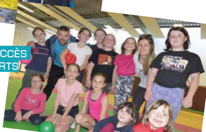
GRAND SUCCÈS CAP SPORTS