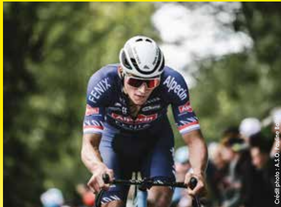
MATHIEU VAN DER POEL