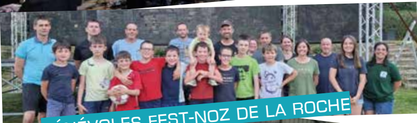
BÉNÉVOLES FEST-NOZ DE LA ROCHE