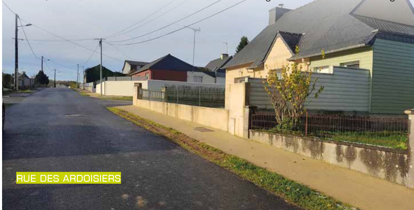
RUE DES ARDOISIERS

La mise en conformité des différents réseaux d'eau se poursuit sur la commune. Ainsi, la rénovation du réseau d'eau potable a été effectuée dans les rues Julien Maunoir, de la Gare et Surcouf à Saint-Guen. Il en a été de même dans le village de Curlan à Mûr-de-Bretagne.