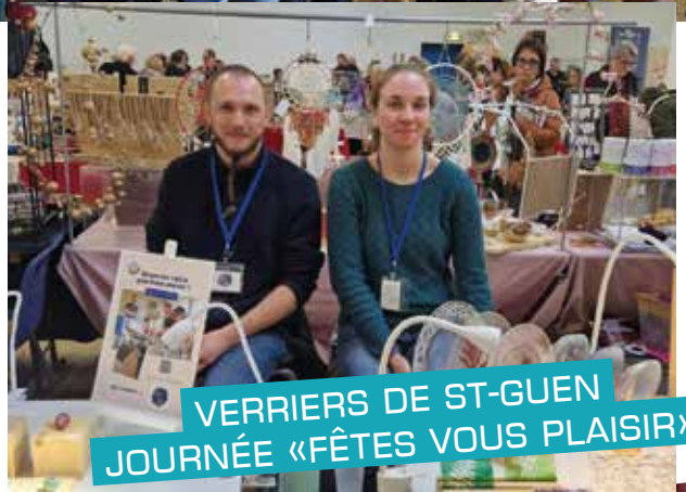
VERRIERS DE ST-GUEN JOURNÉE «FÊTES VOUS PLAISIR»