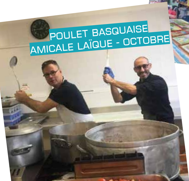
POULET BASQUAISE AMICALE LAÏQUE - OCTOBRE