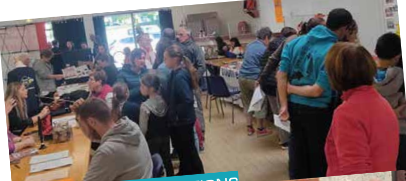
FORUM DES ASSOCIATIONS SEPTEMBRE