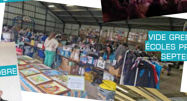
VIDE GRENIER DES ÉCOLES PRIVÉES EN SEPTEMBRE