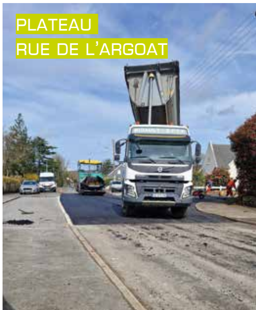
PLATEAU RUE DE L'ARGOAT