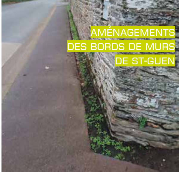
AMÉNAGEMENTS DES BORDS DE MURS DE ST-GUEN